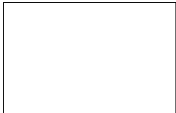
ติดรูปตราสัญลักษณ์สินค้า